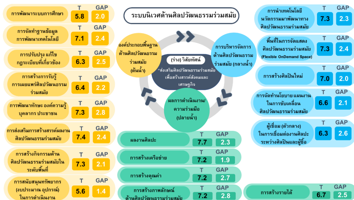
รูปที่ ๒ ระบบนิเวศการส่งเสริมศิลปวัฒนธรรมร่วมสมัย

จากรูป ๒ ระบบนิเวศการส่งเสริมศิลปวัฒนธรรมร่วมสมัย แสดงให้เห็นถึงคะแนนของฐานข้อมูลในเป้าหมายของการพัฒนา (T) มีคะแนนเต็มอยู่ที่ ๑๐ คะแนน และการทำงานต้องมีคะแนนไม่ต่ำกว่า ๘.๕ ซึ่งภายในการทำงานที่ผ่านมาของการพัฒนาศิลปวัฒนธรรมร่วมสมัยตามทีแสดงมีคะแนนต่ำกว่า ๘.๕ แสดงว่าหน่วยงานสามารถดำเนินการอะไรก็ได้ แต่ต้องดำเนินการให้ระบบนิเวศสามารถหมุนตัวได้เร็วขึ้น และมีคะแนนมากกว่า ๘.๕ โดยการจัดทำโครงการ Quick Win ให้เกิดผลการดำเนินงานได้ทันทีและพัฒนาได้สมดุลจนถึงเป้าหมาย อีกทั้งจากภาพยังแสดงให้เห็นว่า GAP ช่องว่างในการพัฒนา มีช่องว่างต่ำกว่า ๕ คะแนน ถือว่าอยู่ในระดับปานกลาง ถ้ามีคะแนนมากกว่า ๕ คะแนน หน่วยงานที่เกี่ยวข้องต้องมีการกำหนดโครงการ/กิจกรรมที่สามารถดำเนินการพัฒนาและลดช่องว่างให้มีระดับต่ำอยู่ระหว่าง ๐.๕ ถึง ๑ คะแนนจะสามารถพัฒนางานศิลปวัฒนธรรมร่วมสมัยได้ดี