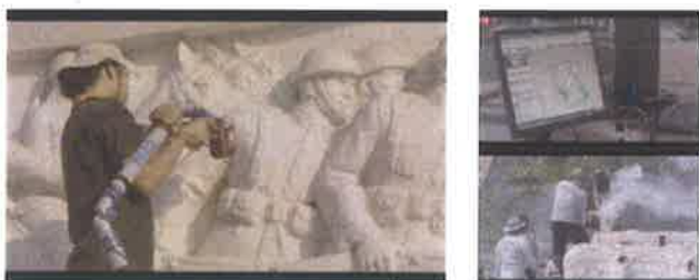
A single-channel HD videos