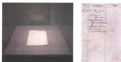
Ink on paper hand copied of the Last page of Hitler's guess book